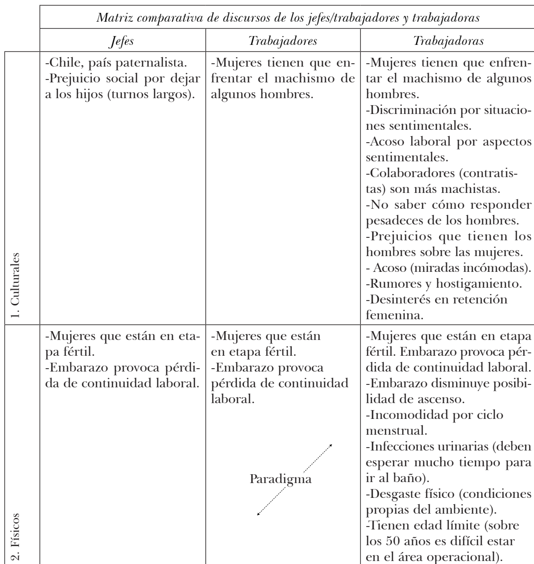
CUADRO 2 EJE: OBSTÁCULOS DE LAS MUJERES PARA TRABAJAR EN MINERÍA