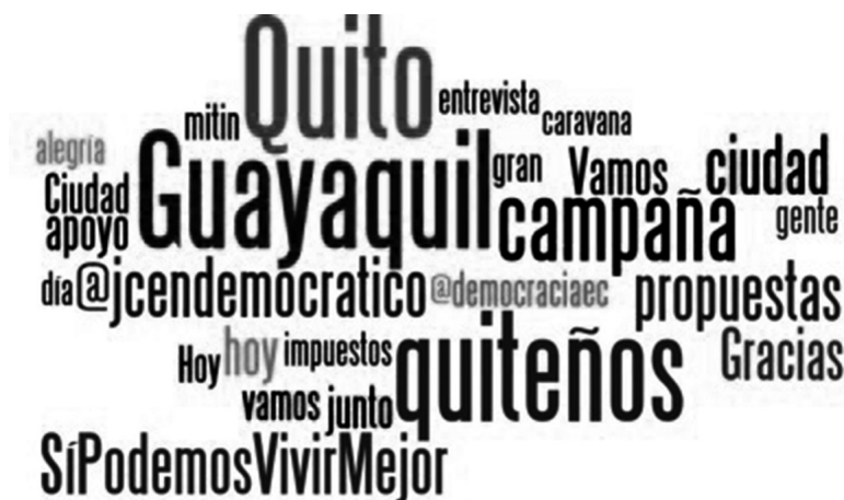
GRÁFICA 2 LAS 25 PALABRAS MÁS TWITTEADAS POR SIETE POLÍTICOS ECUATORIANOS DURANTE LA CAMPAÑA 2014

La gráfica 2 registra las 25 palabras que aparecieron con mayor frecuencia en los 1 614 tweets de los políticos analizados en este estudio. La gráfica muestra la importancia de la referencia a las dos ciudades en que la disputa electoral era más relevante para los actores: Quito, quiteños y Guayaquil. Esta primera aproximación muestra referencias genéricas (“alegría”, “vamos”, “ciudad”, “apoyo”, “gracias”, “propuestas”). Unas pocas palabras pueden entenderse en referencia directa a lemas de campaña (“Sí podemos vivir mejor”) y agrupaciones (@jccendemocraico / @democraciaec / @movimientovive), aunque las mismas no expresan referencias directas a partidos o movimientos políticos (sólo a @movimientovive).