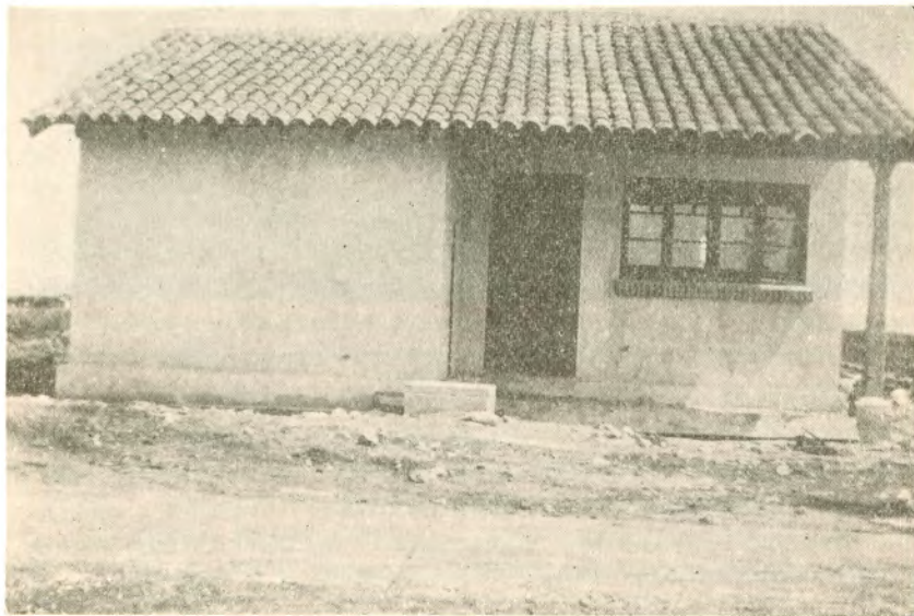
“Casa Tipo” para ejidatarios, construída por la Cooperativa “Emiliano Zapata” en Zacatepec, Morelos.

En el año de mil novecientos treinta y seis, se inicia la construcción de un gran ingenio central en la que antes fué Hacienda de Zacatepec, propiedad de Juan Pagaza; y para el año de mil novecientos treinta y siete, se concluye con un costo aproximado a dieciséis millones de pesos, haciéndose la primera zafra de prueba.