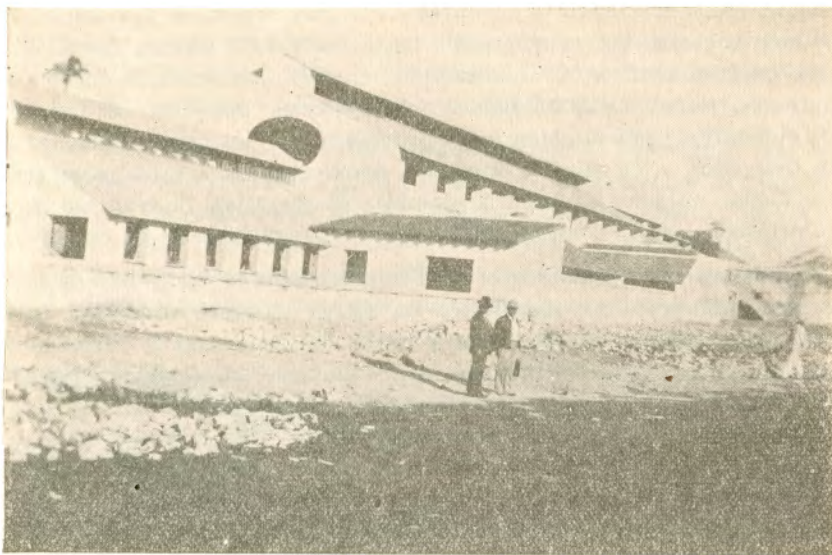
Escuela Agrícola en construcción por la Cooperativa "Emiliano Zapata" en Galeana, Morelos.

Junto a las ruinas de la hacienda de Zacatepec (ahora con ligeras reparaciones), a unos doscientos cincuenta metros, se levanta el ingenio central "Emiliano Zapata"; está montado con la maquinaria más moderna, los últimos adelantos de la ciencia se han tomado en consideración y, desde el laboratorio químico, se vigila constantemente el desarrollo de los cultivos para que, en el momento preciso, se dé la orden de corte, y la caña, conducida en vagones que arrastran cuatro máquinas propiedad del ingenio, por medios mecánicos sea puesta en los molinos para sacar el guarapo y de allí seguirse todo el proceso de la industrialización hasta producirse azúcar de primera calidad.