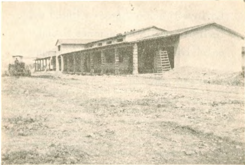
Edificio en construcción, que ocupará la Cooperativa, el Restaurant y el Casino del Ingenio Central "Emiliano Zapata", en Zacatepec, Morelos.

vas que en mil novecientos veintidos concedió el General Alvaro Obregón, para el año de mil novecientos treinta y cinco, se habían constituido ciento ochenta ejidos con un total de tierras ejidales de 212,006 hectáreas, más del cincuenta por ciento de la superficie total del Estado. Actualmente el número de ejidos es de doscientos cinco aproximadamente.