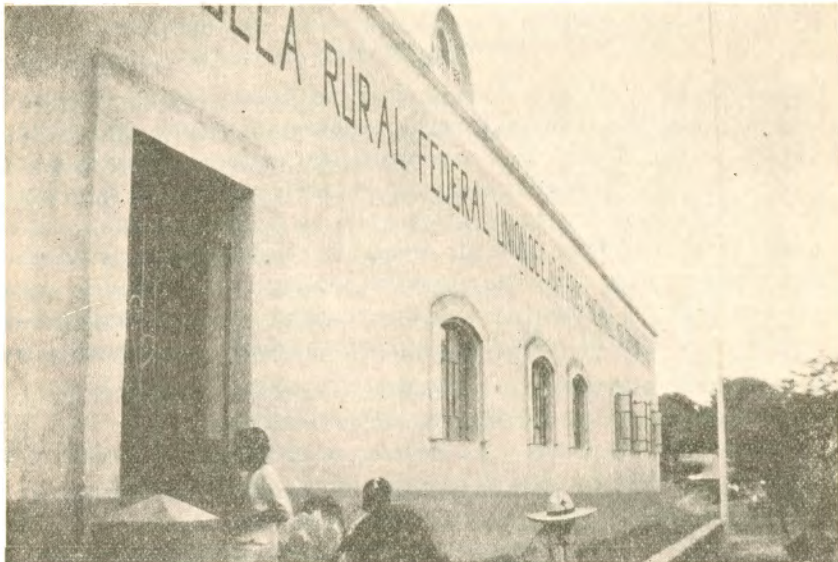
Escuela ejidal en Panchimalco, construída con la aportación de los ejidatarios de Morelos.

Tal vez el mejor ejido sea el de Tlaquiltenango, se encuentra perfectamente parcelado en lo que se refiere a las tierras de riego, habiéndose entregado a cada ejidatario dos hectáreas y media de tierra, con la circunstancia de que las parcelas están ya tituladas, así es que este parcelamiento tiene carácter definitivo. En la visita que se practicó pudo observarse que la localización de las parcelas ha traído algunos problemas, pues, al hacerse los deslindes respectivos, no se puso el cuidado necesario y en algunas ocasiones se constituyeron parcelas de más de la extensión amparada por los títulos respectivos, lo que significará una disminución para otras.